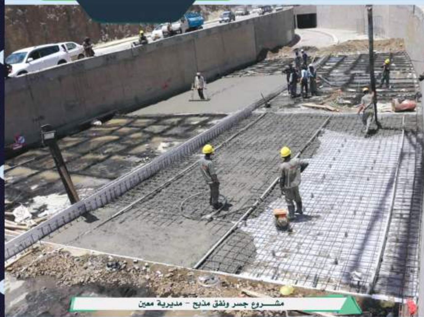
مشروع جسر ونفق مذبح - مديرية معين