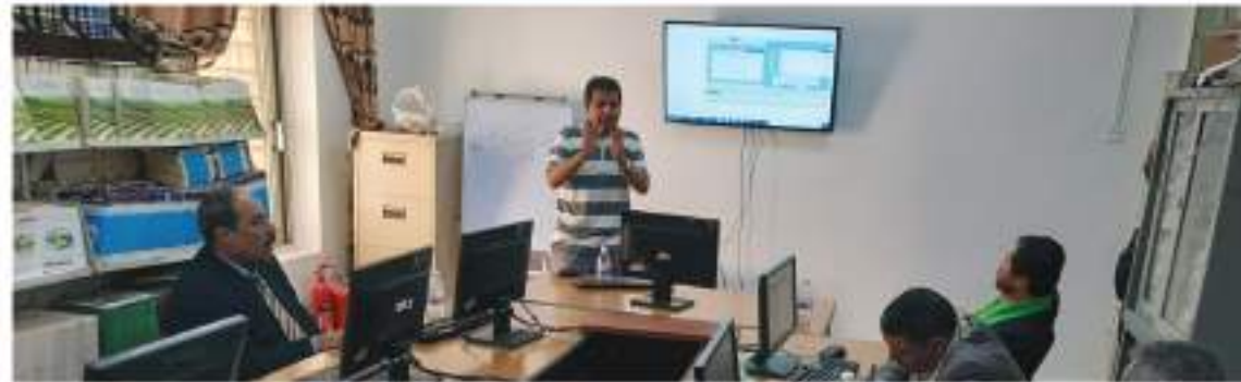
سير عملية التدريب في مكاتب الإدارات العامة