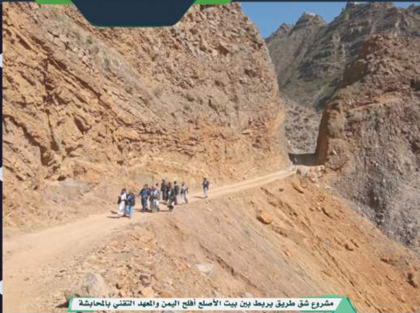
مشروع شق طريق يربط بين بيت الأصلع أفلح اليمن والمعهد التقني بالمحابشة