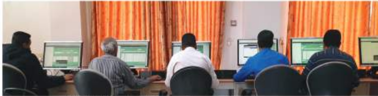
سير عملية التدريب في مركز المعلومات بالوزارة