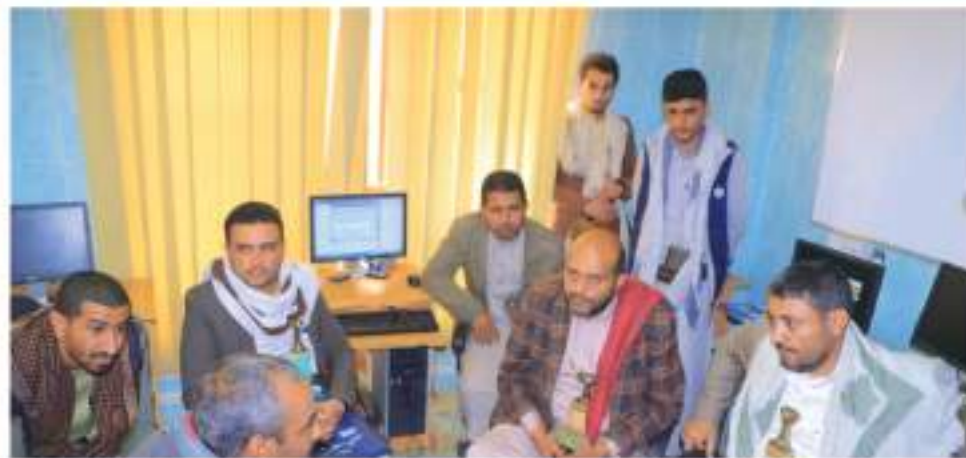
تدشين عملية التدريب على الأنظمة في محافظة صنعاء