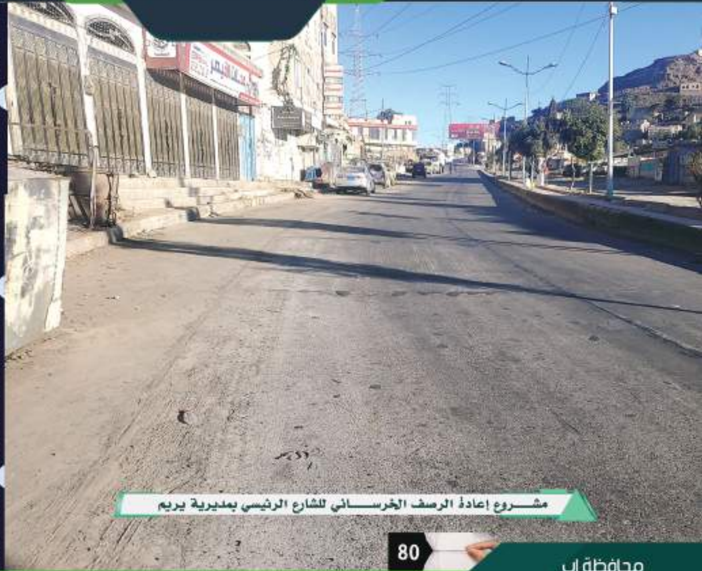
مشروع إعادة الرصف الخرساني للشارع الرئيسي بمديرية يريم