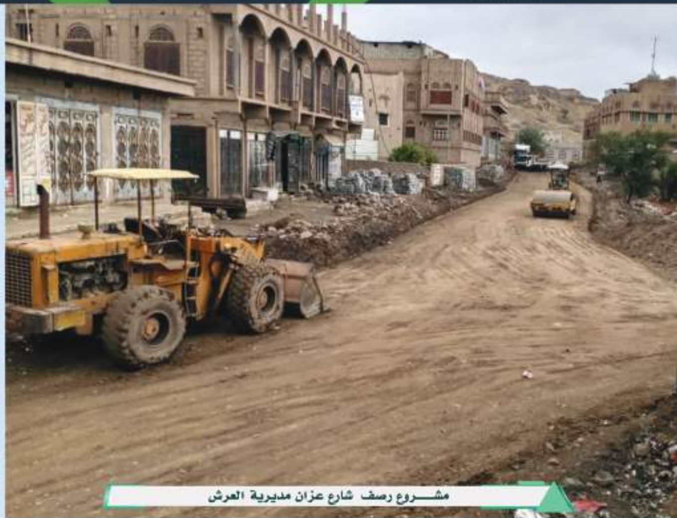
مشروع رصف شارع عزان مديرية العرش