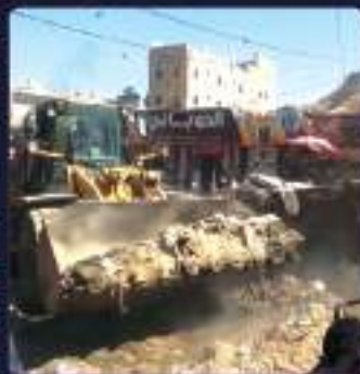
مشروع جسر الشرنمة محافظة الضالع