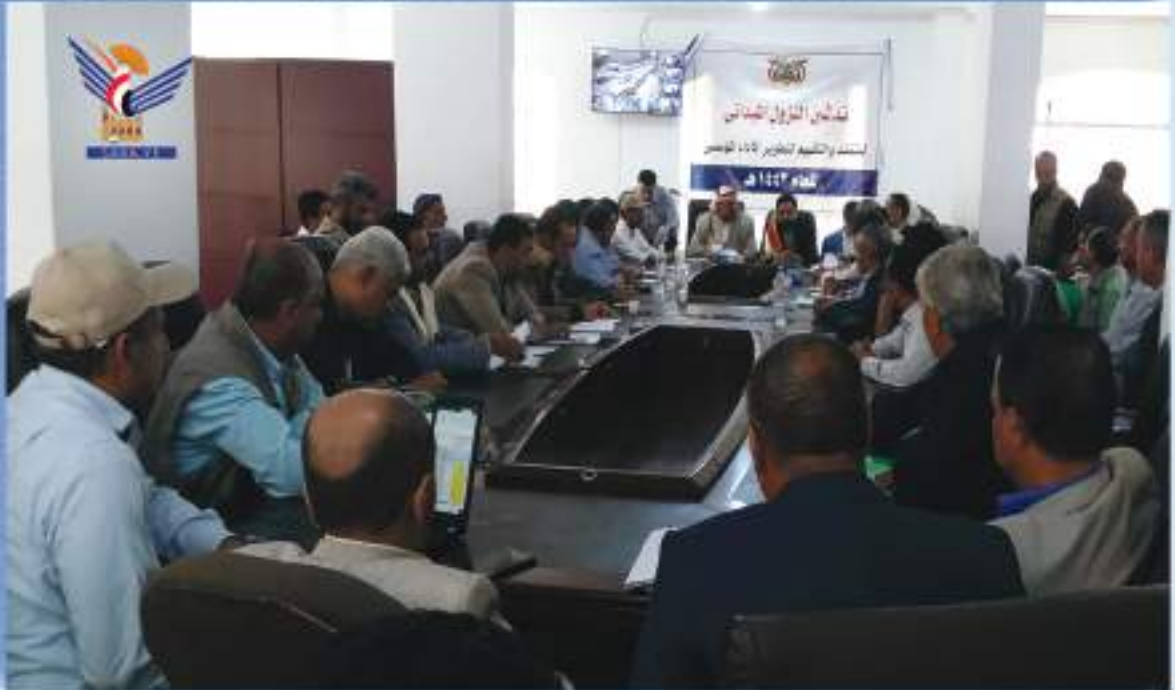
تفقد وتقييم أداء أجهزة السلطة المحلية