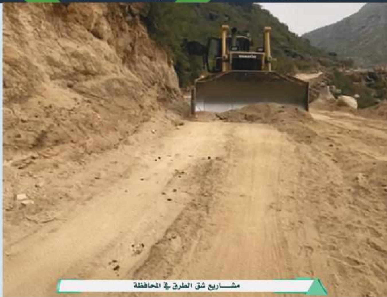
مشاريع شق الطرق في المحافظة