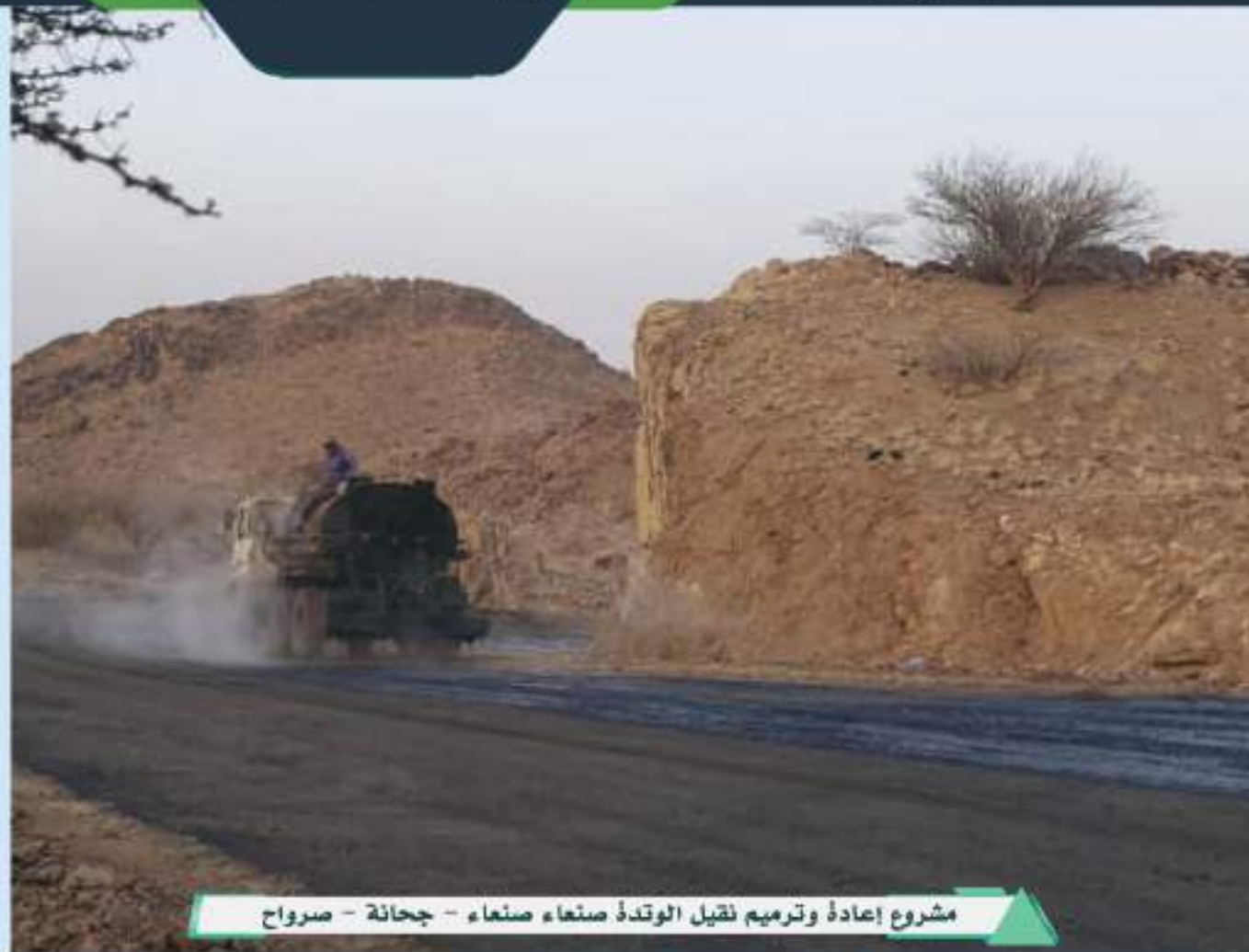
مشروع إعادة وترميم نقيط الوند صناعاً - صناعاً - جحانة - صرواح