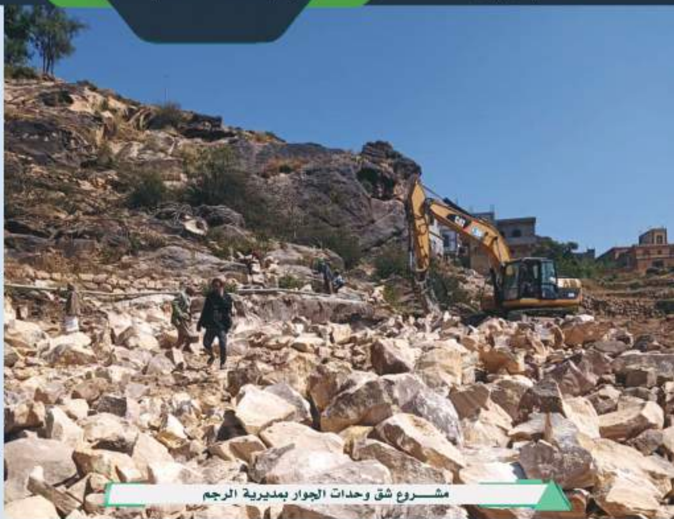
مشروع شق وحدات الجوار بمديرية الرجم