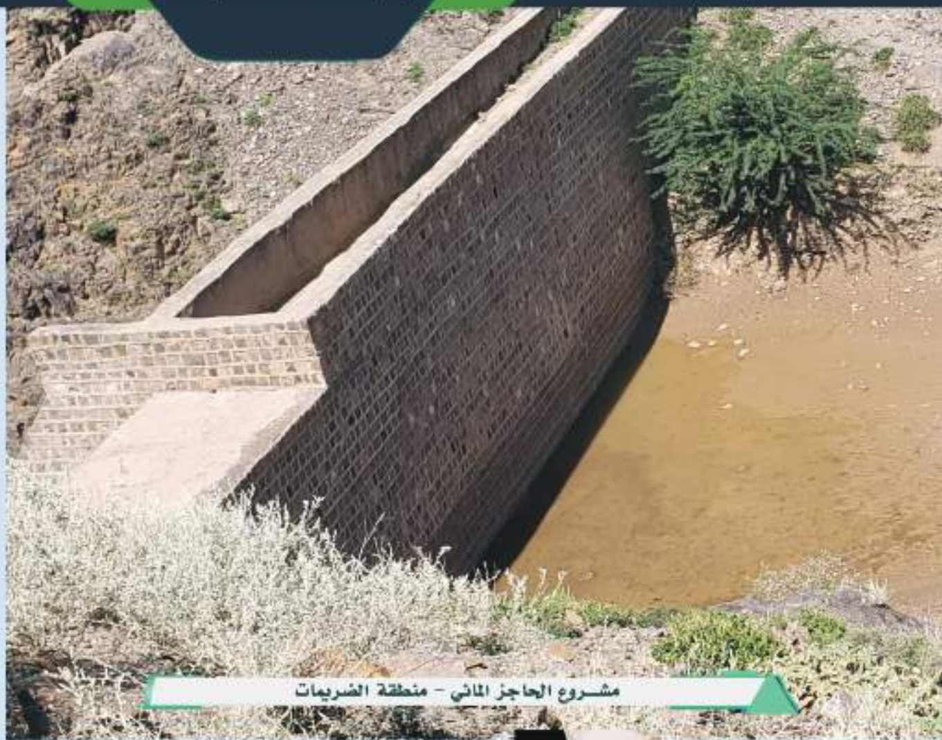
مشروع الحاجز المائي - منطقة الضريعات