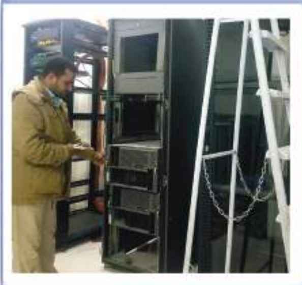
الربط الشبكي في ديوان عام الوزارة