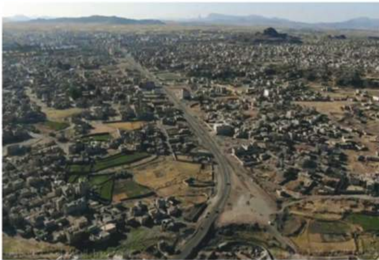
مشروع سفلتة طريق الدائري الشمالي الشرقي بمدينة ذمار