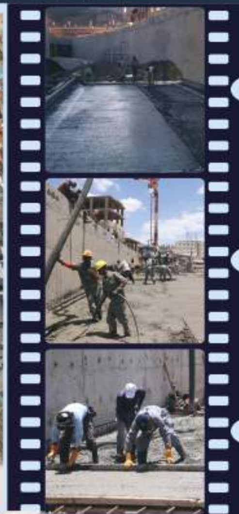
مشروع قناة تصريف مياه الأمطار من شارع البحث الجنائي حتى السائلة العظمى