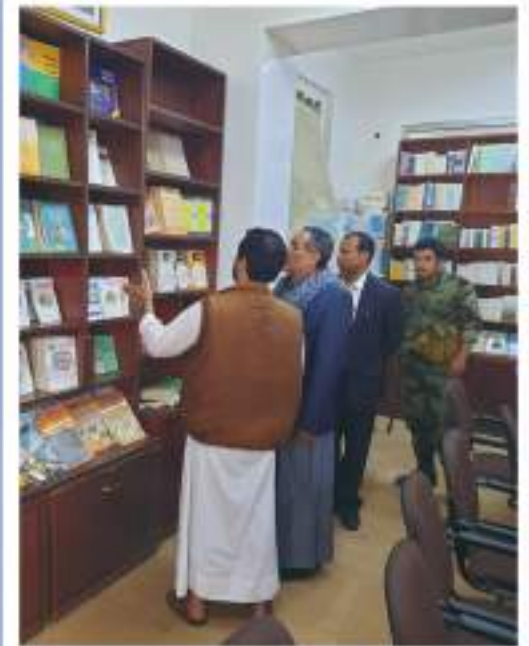
تجهيز المكتبة العامة