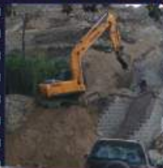
مشروع توسعة المدخل الرئيسي لمدينة حجة - شارع صنعاء