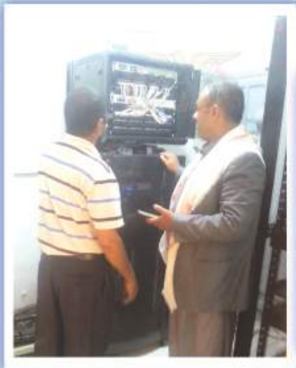
الربط الشبكي مع محافظة صنعاء