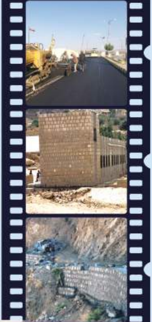
مشروع الحاجز المائي - قاعة العشة - محافظة عمران