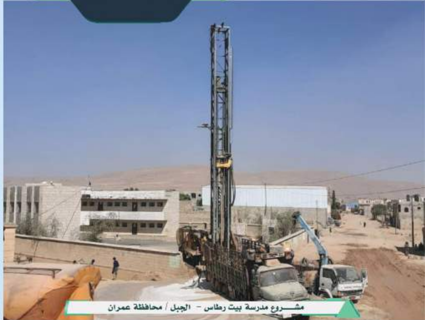
مشروع مدرسة بيت رطاس - الجبل / محافظة عمران