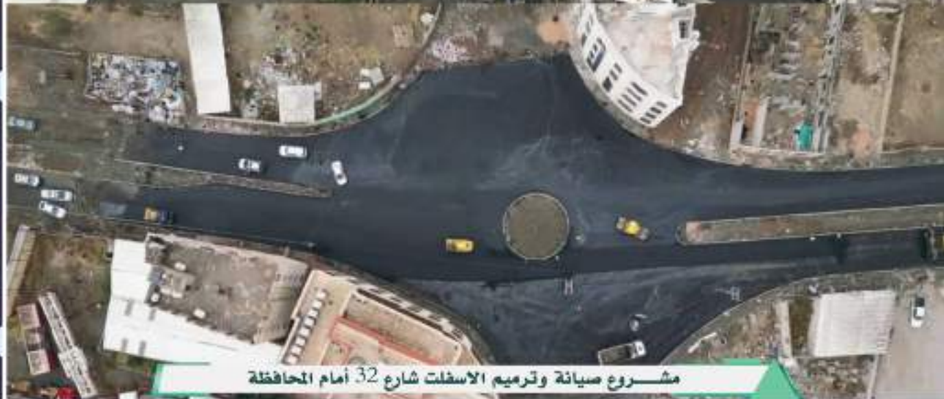
مشروع صيانة وترميم الاسفلت شارع 32 أمام المحافظة