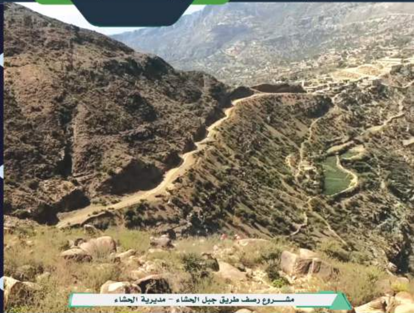
مشروع رصف طريق جبل الحشاء - مديرية الحشاء